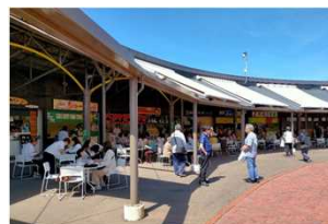
地元のお店が軒を連ねるオープンテラス

チューリップの本場オランダや国内の生産地などから毎年新しい品種を導入し、春が遅く冷涼なオホーツクの気候を利用し、開花時期を工夫したこの公園ならではの雄大な景色を作りあげています。「かみゆうべつチューリップフェア」の開催期間中は、5万人を超える来園者があり、入園ゲートの手前に地元でも味自慢の飲食店やお土産店などが軒を連ねるアーチ状のオープンテラスのお店があり、ゆっくりと買い物や食事を楽しんでいただけます。また、園内にはチューピットショップが用意され、お天気が悪くても室内でお買い物や休憩もでき、ご自宅でチューリップを育ててみたい方には球根の予約販売も行っています。