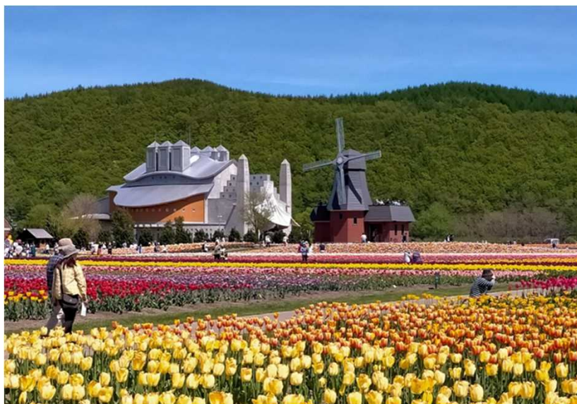
およそ200品種70万本のチューリップが咲き誇る