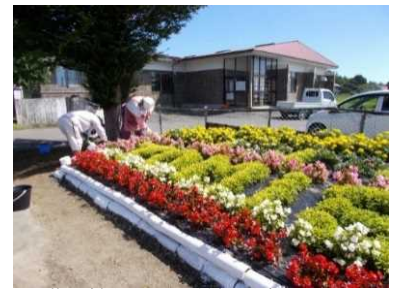
花の植栽による景観形成活動