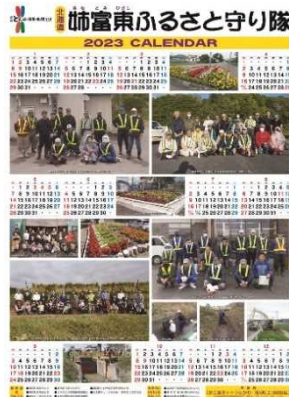
毎年作成しているカレンダー

また、活動参加者の集合写真などを掲載したカレンダーを毎年作成・配布し、啓発・普及活動を行っています。