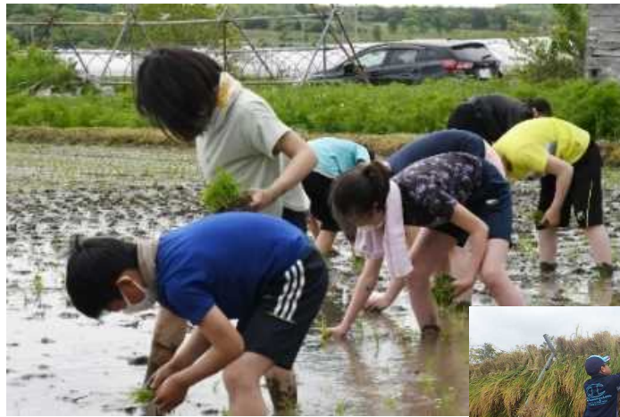
小学生を対象とした米作り体験