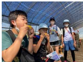
朝採りとうもろこしの試食