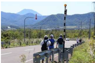
チェックポイント巡り

赤井川観光協会は、イベント内容の充実を進め、SNSの積極的な活用を通じた情報発信に重点を置くことで、観光客の増加を目指しています。