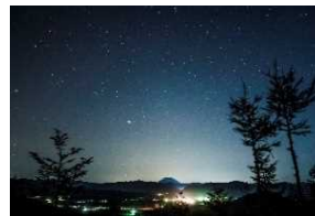
令和元年開催のフォトコンテスト 最優秀賞 カルデラを照らす星々

赤井川観光協会では、農村景観維持のため、草刈りやゴミ拾いなどの活動を行い、自然豊かな村の魅力を体感していただくため、フォトコンテストやほたる鑑賞会など各種イベントを実施し、地域一体で観光地域づくりを行っています。