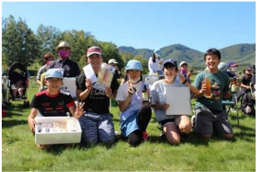
幅広い年齢層の方々が、赤井川村のチェックポイントをメグリました