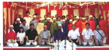
様々な担い手による神楽の伝承

神楽の踊り手は豊郷集落の農家の長男に限定されていたことから、100年目の記念講演時には13名と存続の危機に直面したため、会員の対象者を男女や市内在住を問わず広げて募集し、小学校の授業で踊りを習った経験のある中高生も含めて、合同で神楽を継承しています。地域の芸能祭や姉妹友好都市との交流時など、地域内外と積極的に交流することにより認知度を上げ、郷土芸能として広く市民に理解されてきました。