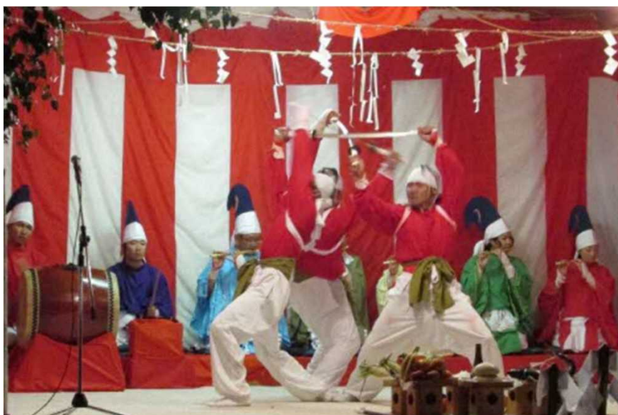
114年の間、一度も休まず続く豊郷神楽の奉納（毎年8月1日）