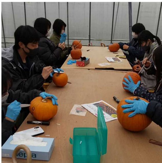
コロナ禍期間中の受入風景（ハロウィン用のランタン作り）