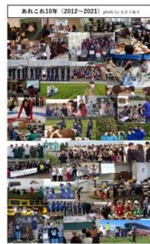
20周年記念誌 からの抜粋

一生の思い出を作れるようにと受入活動を行ってきた結果、20年以上の活動期間で1万7千人以上の方々に農業体験をしていただいていたいて、最近では海外から来る方にも体験をしていただいています。