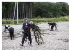
漁業体験（体験ツアー）

広尾町には、日高山脈が織りなす景観や多様な一次産業といった地域資源が存在しています。広尾町の魅力を多くの人に伝えるために、これからも活動を展開していきます。協議会の活動がきっかけで広尾町への移住にまで繋がれば嬉しいです。