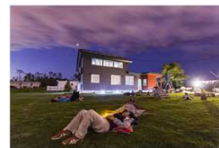
星空鑑賞（体験ツアー）