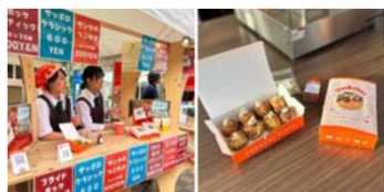
サンタのつぶやきの販売