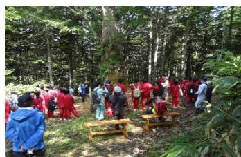
音夢路を散策する地元高校生

ウォーキングの集いは、年5回程度、9kmのコースを3時間半かけて歩くもので、森の持つ癒し効果で心身ともにリフレッシュが図られ、参加者の健康増進に役立っています。また、休憩用イスやトイレの設置など利用しやすい環境を会員自ら造り上げており、森の象徴である樹齢360年のミズナラの巨木など多様な樹種のほか、この地域では最高峰の函岳（美深町・標高1,129m）や歌登市街を一望できる展望ポイントがあり景色を楽しむことができます。さらに、平成28年度には、ふるさと納税の返礼品としてツアー旅行に組み込まれています。