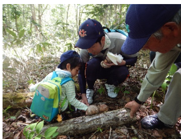
生産の森にある椎茸ほだ木からの採取風景

また、本団体発足以来、間伐材を活用したオブジェ、キノコ栽培や利用者に配慮した環境整備など、手作りの工夫により活動が進化し、年々、札幌など