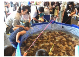
鮮度抜群の海産物とイベントの様子

ただ単に入場者を増やすことが目的ではなく、来てもらった人にどれだけ楽しさを伝えられるかを重視して、このイベントをきっかけに「食」による知名度の向上を図り、周辺観光に結びつけられることを願っています。