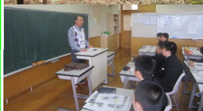
天塩中学校での植育教育の様子