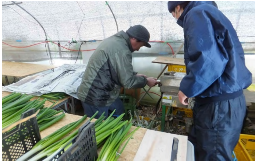
町内の農家さんの指導を受けて出荷作業を手伝う様子