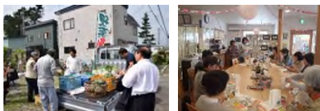
年2回のイベントの様子

地域との交流事業として年2回イベントを開催したり、町内外のイベントでの物品販売やPR活動も行っています。