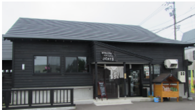
銭湯をリノベーションしたレストラン