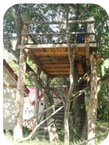
制作中のツリーハウス

また、外国人の宿泊客も積極的に受け入れ、実績を伸ばしており、更に子どもたちが楽しめる事を色々と提供していく予定です。