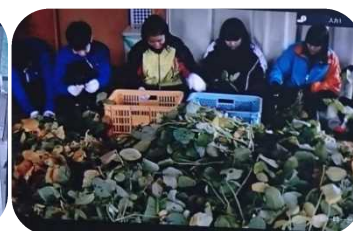
移動式ピザ釜（左）高校生職業体験風景（右）