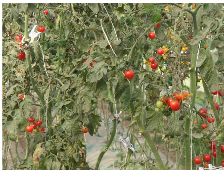
ごんた村ビニールハウス内のミニトマト