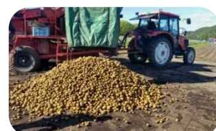
苗の植え付け（左）と 収穫の様子（右）