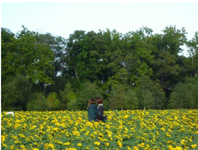
観光客に人気の「ひまわり」畑