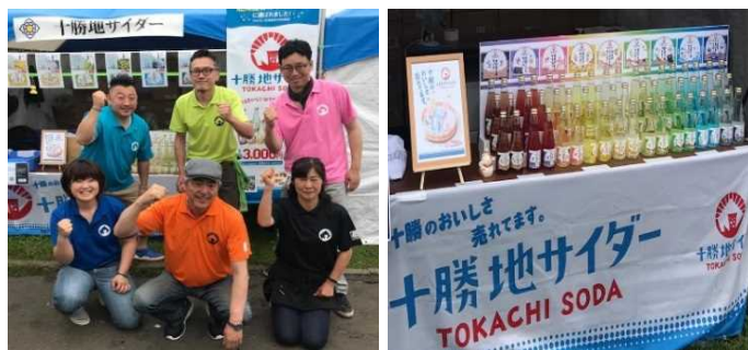
イベントでの様子