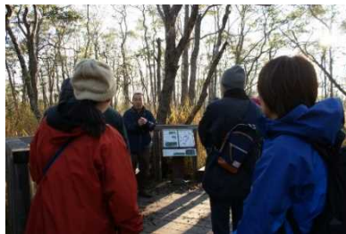
釧路湿原 自然ガイドツアーの様子

へ農泊体験メニューの促進により長期滞在者との交流を深め、短期移住・移住を検討する方々への情報提供にも積極的に取り組んでいます。