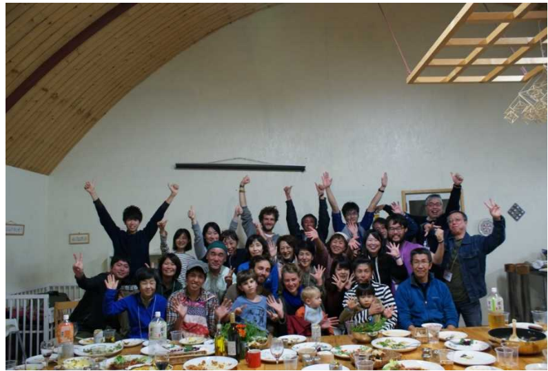
農泊推進事業によるインバウンドの受入れと都市農村交流会の様子