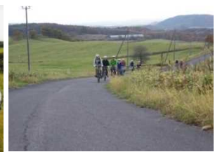
まちなかサイクリングの様子