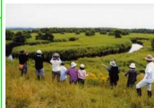
キラコタン岬からの眺望

鶴居村は、冷涼な気候を活かした酪農業や林業が盛んな地域です。緩やかな丘陵が続く農村景観のほか、日本一の大きさの釧路湿原がありタンチョウヅルなどの野鳥やエゾシカなどの野生生物と出逢うことができます。農泊地域ならではの都市部ではない、農業体験や地元の人々との交流など農泊地域ならではのステイを楽しむことができます。