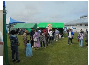
チーズフォンデュに長蛇の列