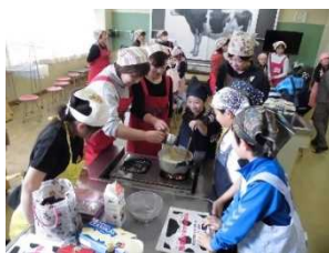
出前授業の一コマ