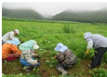
手作業による雑草駆除作業

落のレシピ紹介により、若い世代の方々が購入しており、佃煮の復元、落の葉の抽出液の活用など、様々な形で落を発信しています。連携先では、閉鎖されていた落加工場が再開され、雇用が創出されており、落を製品化する時に出る皮を活用し、和紙「富貴紙」を地元特産品として販売しています。