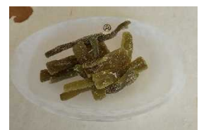
アンジェリカ (スイーツ)