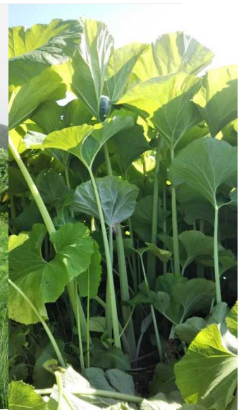
無農薬の落栽培の音別ふき落団