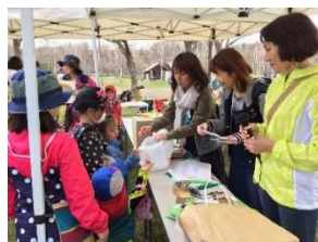
町の景観を利用した 第2回アドベンチャーウォークラリー 平成29年4月(参加者80名)