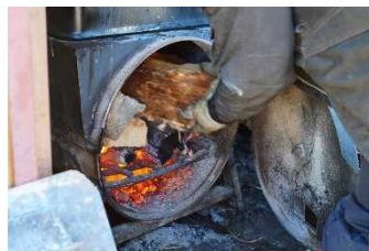
シロップを製造するボイラー (左) と燃料の薪 (右)