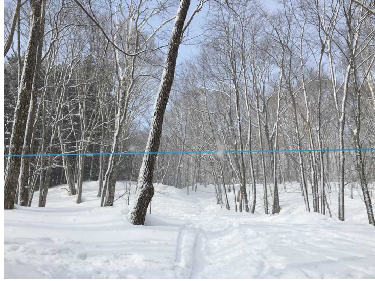
樹液を採取する「メープルの森」 (青い線は樹液を採取するチューブ)