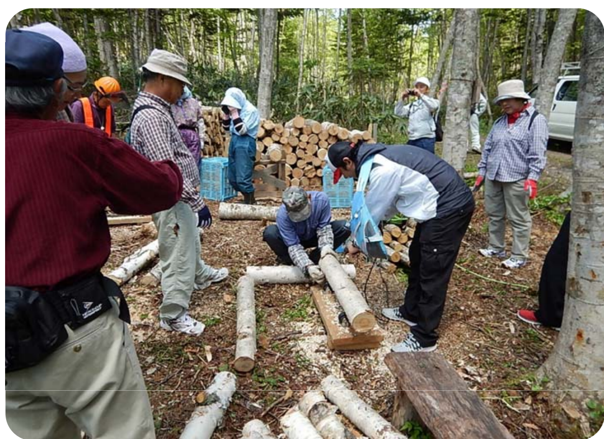
キノコのホダ木製作

また、本団体発足以来、間伐材を活用したオブジェ、キノコ栽培や利用者に配慮した環境整備など、手作りの工夫により活動が進化し、年々、札幌など他地域の参加者や子供の参加も増え、世代・地域を超えた交流の輪が広がり、地域コミュニティづくりや都市住民との交流人口増加など地域の活性化に繋がっています。