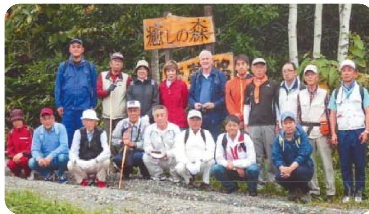
ウォーキング参加者で記念撮影

コースには、森の象徴である樹齢360年のミズナラの巨木など多様な樹種のほか、この地域での最高峰の函岳（美深町・標高1,129m）や歌登市街を一望できる展望ポイントが設けられ、四季折々の景色を楽しむことができます。