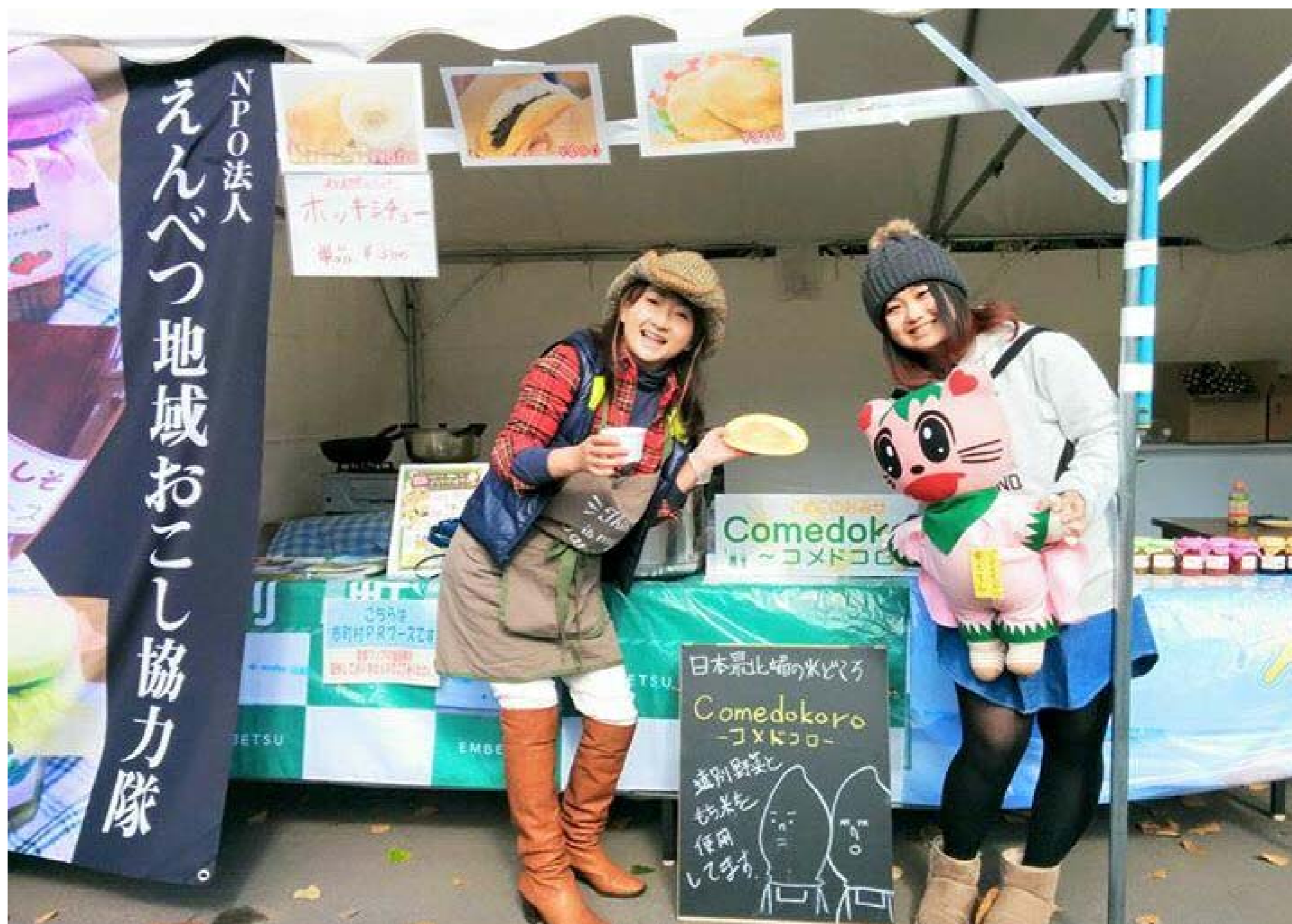
札幌のイベントでPR活動