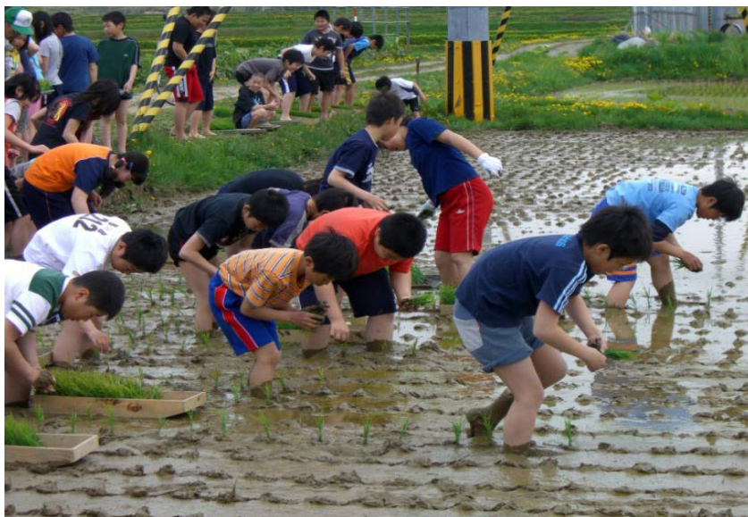
田植え体験の様子