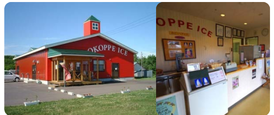
工場兼直売店 (左) と店内の様子 (右)

「おこっぺ」で搾られる生乳は、乳脂肪分が高く、濃い味とコクが自慢です。原料には特に乳質の優れた生産者のものを厳選して使用しています。朝搾られた生乳は、その日のうちに製品になります。既製品で使われる安定剤・増粘剤などの余分な添加物は一切使用せず、生乳のおいしさをそのまま楽しんでいただけるようにしています。