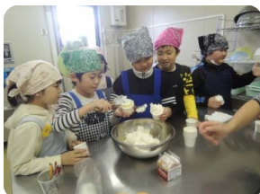
アイスづくり体験 (左) と町外イベントの様子 (右)

町内外のイベントに出店し、おこっぺアイスの販売と同時に興部町のPRを行っています。