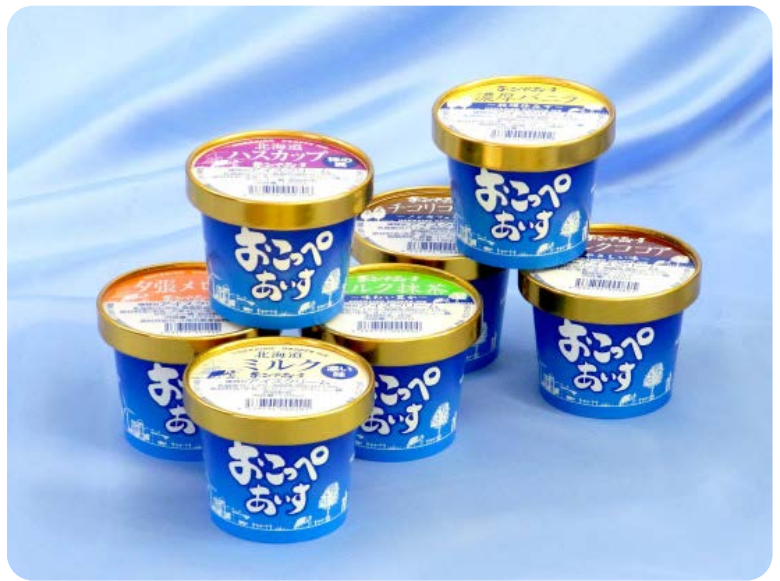
ミルク、バニラ、ココア、抹茶、ハスカップ、チョコリ、夕張メロンの7種類