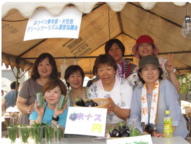
町内イベントでの活動の様子