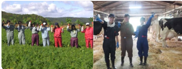
修学旅行生の農業体験の様子

農家と町外の学生が触れ合うことで、農家は家の雰囲気明るくなり、つきあいが広がると感じています。また、津別町の良さを見直すきっかけともなり、農家のやりがいにもつながっています。