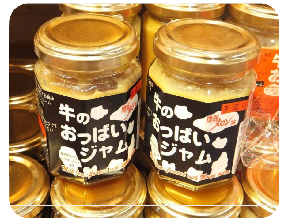
自家生産の生乳を用いた商品