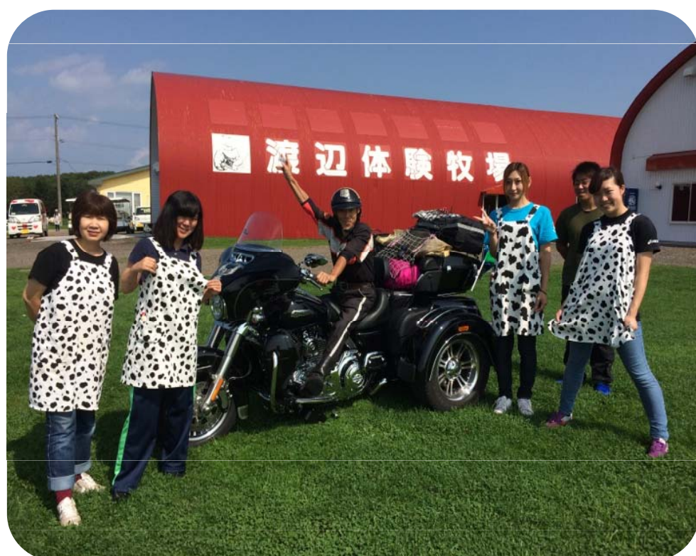
トラクターで草原を周遊(左)旅行者との記念撮影(右)