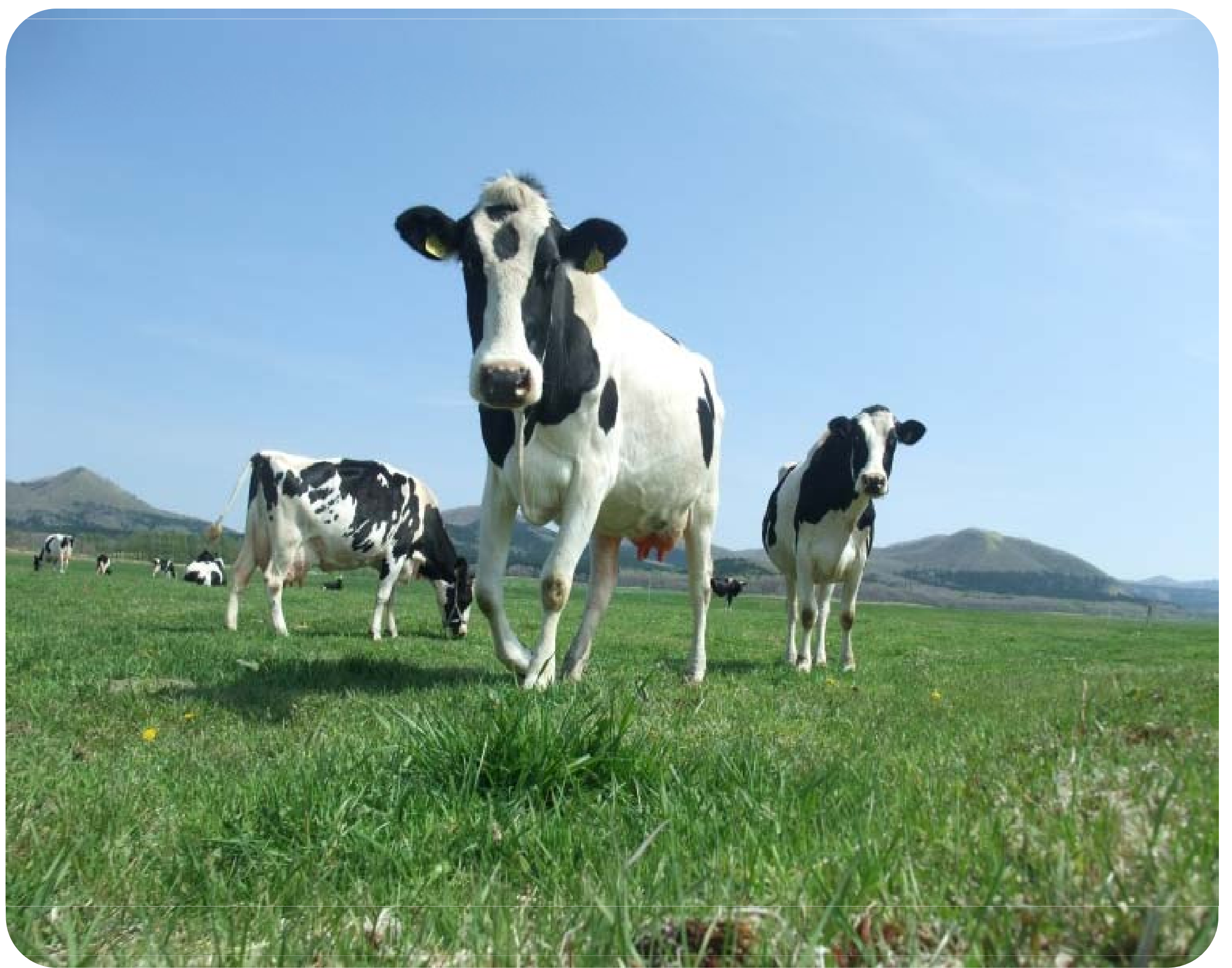
摩周大草原での放牧風景