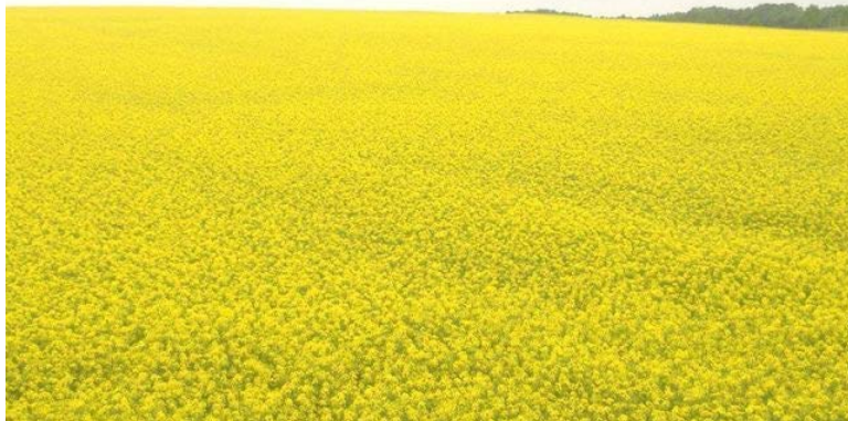
広大な菜の花畑風景