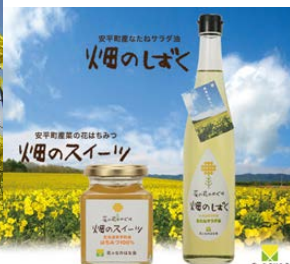
菜の花と関連主商品