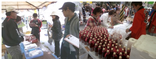
中川町秋味まつり（左）と東京都世田谷区下高井戸 大さくら祭り（右）の様子

ハスカップにはアントシアニンなどが豊富に含まれ視力回復効果があると言われています。