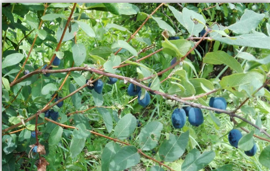
中川町のはスカップ