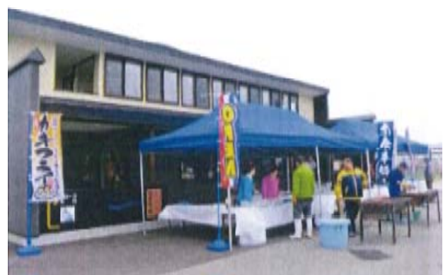
すつつ浜直市場の開設（H27）

具体的には、①修学旅行生・一般客（外国人ツアー含む）を対象とした漁船乗船体験や地引き網体験、②「すつつ浜直市場」の開設と加工体験の充実（H28年、修学旅行生等1500人）による観光型漁村の形成、③修学旅行生の民泊による地元の活性化、④藻場の保全・再生や磯焼け対策としての「海の森づくり」、⑤地域景観づくりのため、国道沿いの植栽活動等を実施し、「寿都・後志ツーリズム交流文化圏」の形成（H18.3策定）を目指しています。