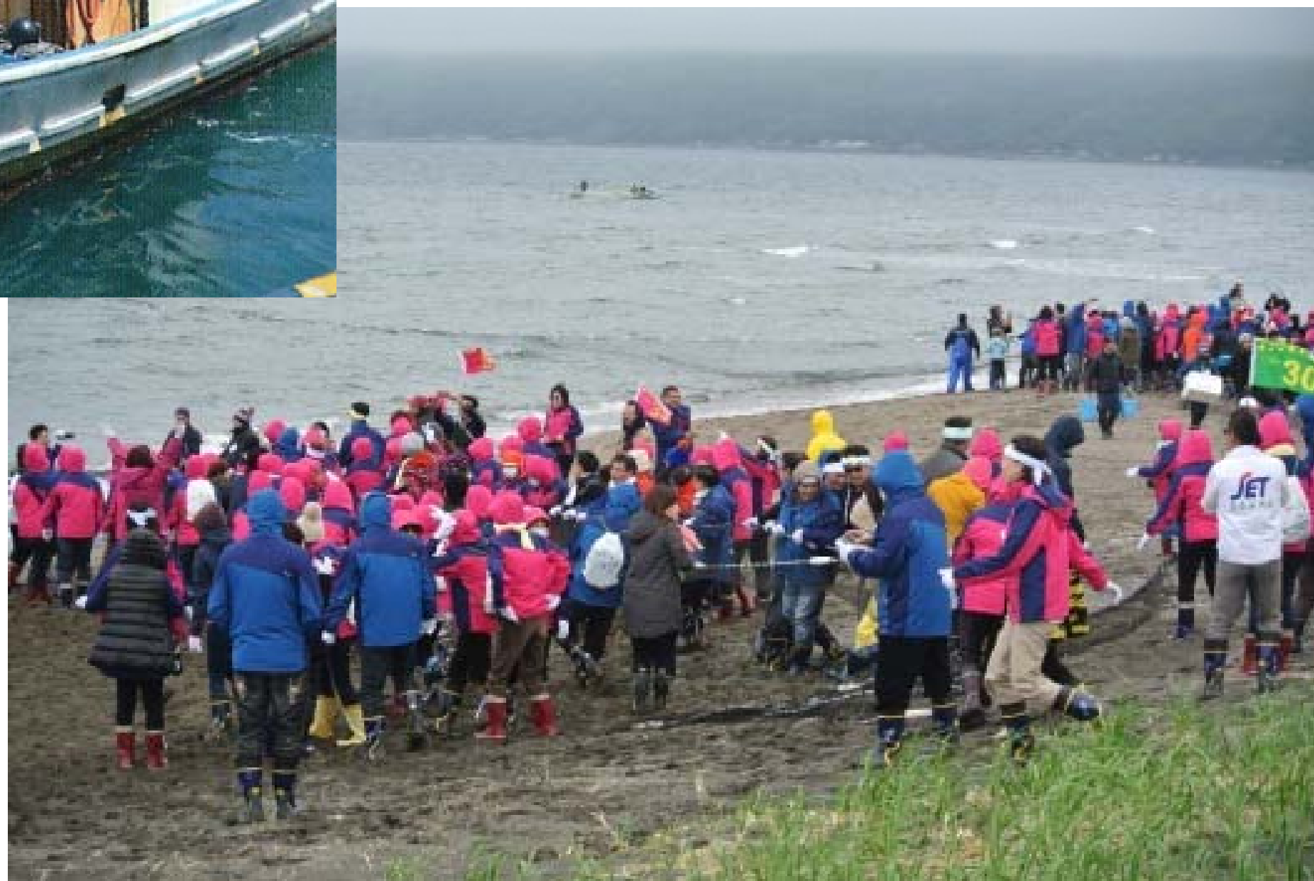
外国人ツアー客（台湾）による地引き網体験