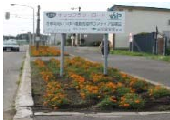
国道沿いのマリールゴールド植栽