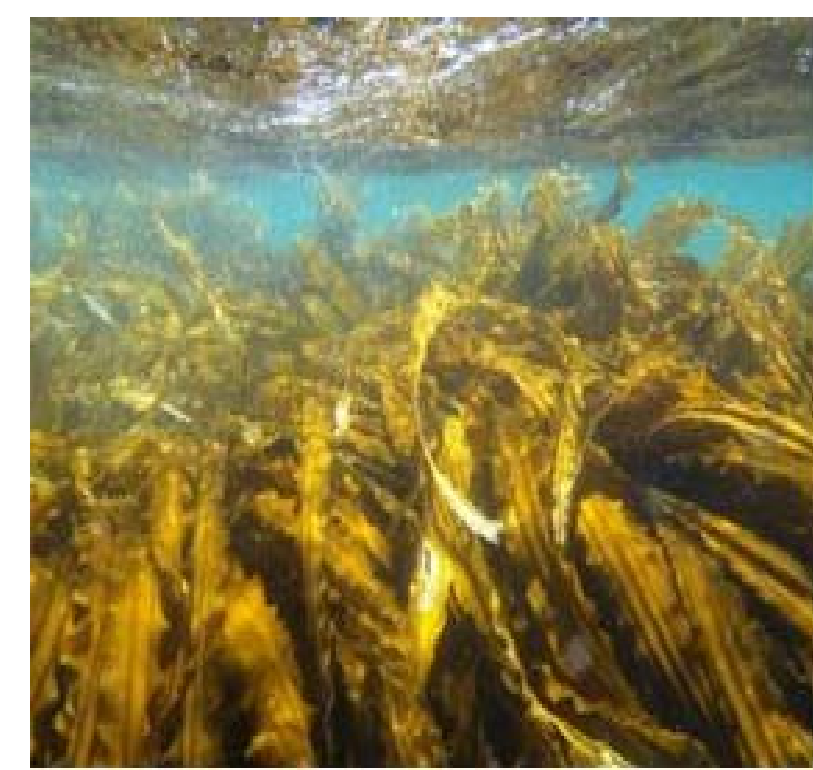
磯焼け対策後、再生した海（藻場）の状況