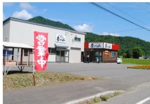
加工・販売「愛ふくふく」

「農産物とその製造品を、安心・安全とともに消費者に提供することに努め、地域社会の繁栄に貢献し、周知を結集して社業の発展と社員の幸福を追求する。」を社是としています。