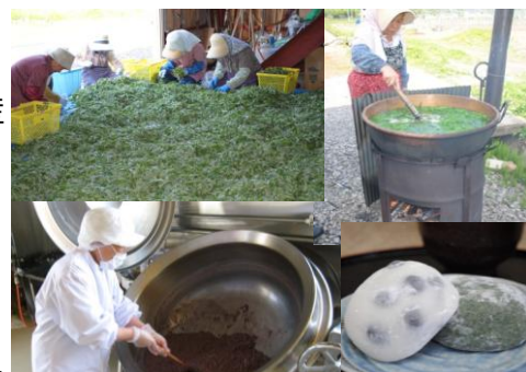
よもぎもちの製造中「あん」「よもぎ」

昭和62年より地域として、もち米専作を選択、27年経過しています。平成19年には地元食材(もち米、大豆、小豆)を中心とした、もち加工事業を開始、「生産、加工、販売」を一貫して行う「協和の里のもち工房 愛ふくふく」をオープン。現在、当事業の拡充取組を展開中です。