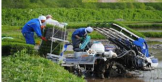
協和農産による農業作業

平成9年4月設立後、高齢化の進む中、農地の集約化を図り担い手の確保、コントラクター事業による耕作放棄地の解消に努めています。