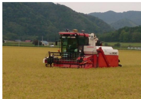
ロボットコンバインで稲を収穫

この整備を契機に、労働力不足のさらなる解消や大区画ほ場の効率的な活用を図るため、先端技術を活用した農作業の省力化・無人化等の研究をすることにより、上士別地区の農業が永続的に発展することを目的としています。